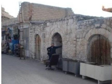
Neues Infozentrum in Hasankeyf - vor der Renovierung.