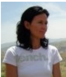
Eva Glawischnig

Bei einem gemeinsamen Pressegespräch im Parlament kritisierten Eva Glawischnig und Ulrich Eichelmann das Vorgehen der Österreichischen Kontrollbank und der österreichischen Bundesregierung in Sachen Ilisu.