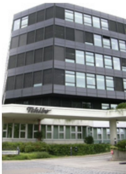
Tchibo Zentrale in Hamburg

Der Konzern Tchibo wurde 1949 von Max Herz und Carl Tchilling gegründet. Aus Tchilling und Bohne wurde der Name Tchibo kreiert. Tchilling stieg später aus. 1955 eröffnete die erste Filiale in Hamburg mit Probeausschank. Mittlerweile gibt es