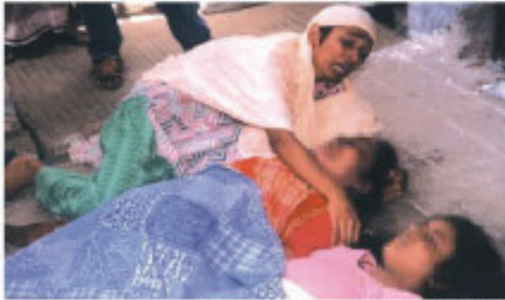
Crying for the dead. The stampede at the Misco Supermarket building left seven crushed to death and fifty injured.

werden sexuell belästigt. Sogar ihre Toilettenbesuche werden eingeschränkt, denn das Ziel der Betriebsleitung ist Druck zu verbreiten und dauernde Kontrolle auszuüben.