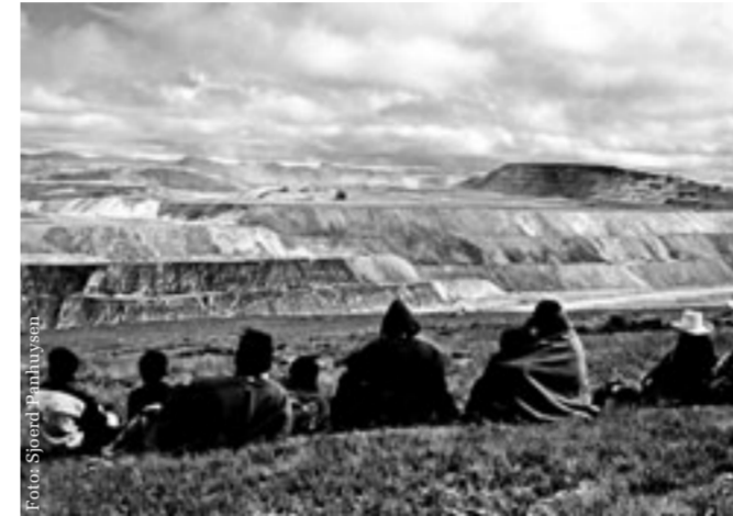
Statt ihrem Land haben sie giftige Abwässer: Yanacocha-Mine in Peru.

Die Dokumentation «Ihre Bank ist auch eine Kohlemine» mit vielen Fallbeispielen kann direkt auf www.evb.ch oder bei nebenstehender EvB-Adresse bestellt werden (Fr. 6.– plus Versandspesen). Die englischsprachige Hintergrundrecherche dazu finden sie auf www.evb.ch/researches beziehungsweise www.evb.ch/researchubs oder www.greenpeace.ch