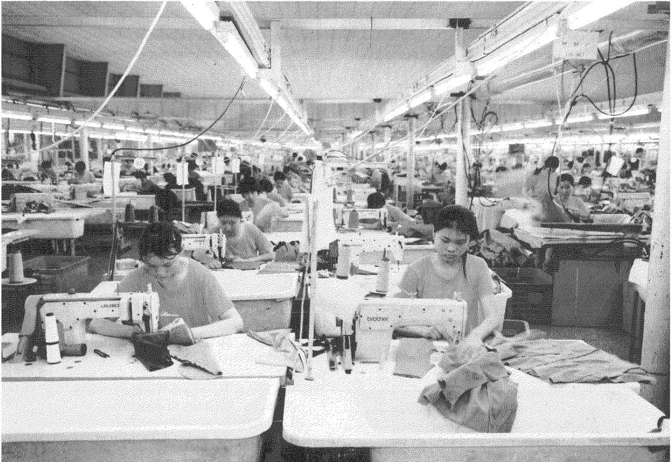
Bei so vielen Näherinnen verteuern selbst geringe Lohnerhöhungen die Endprodukte massiv.

Chinesische Textilfabriken produzieren immer mehr für den heimischen Markt. Schweizer Abnehmer müssen immer länger auf die Ware warten. Und entdecken darum die Vorteile der Produktion in Europa.