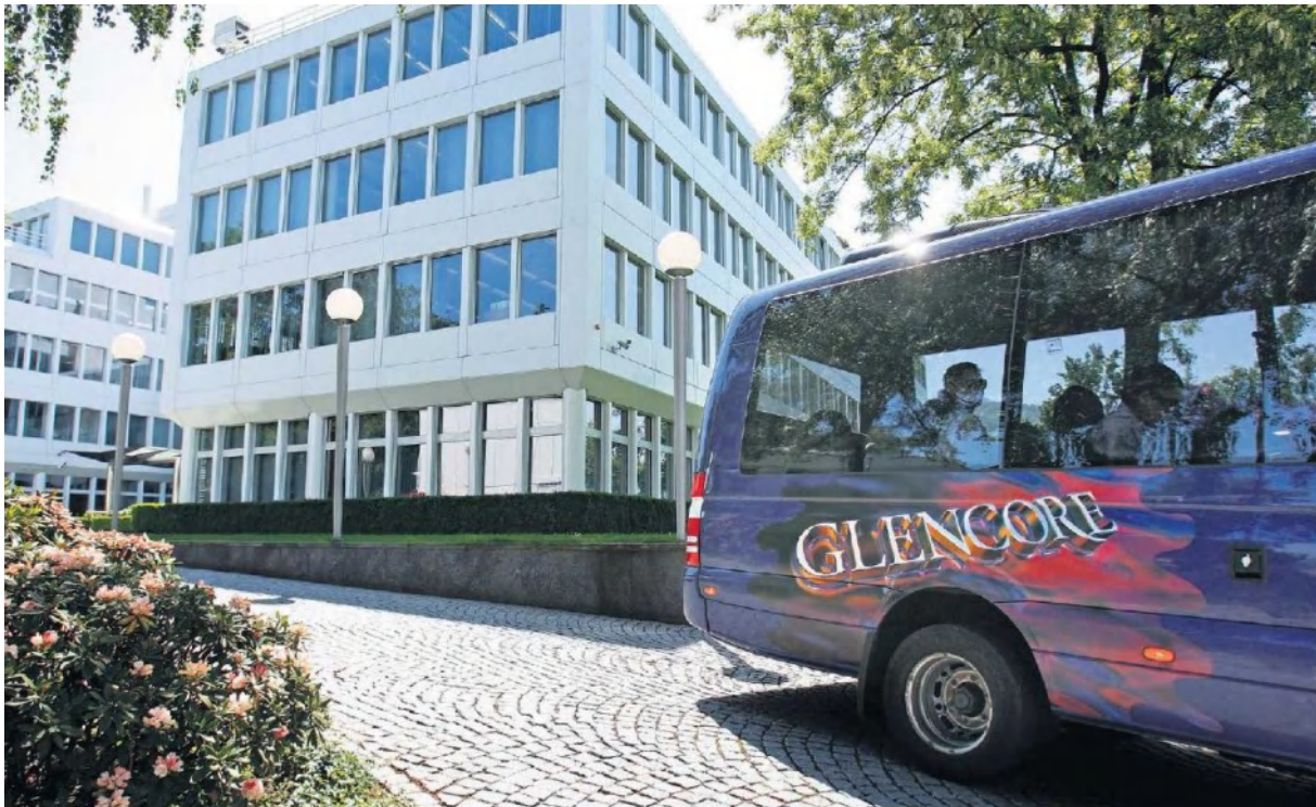
Firmensitz von Glencore in Baar: Börsengang wird «wie ein Flug zum Mars»

Der Börsengang wird für den diskreten Zuger Rohstoffhändler ein Kulturschock