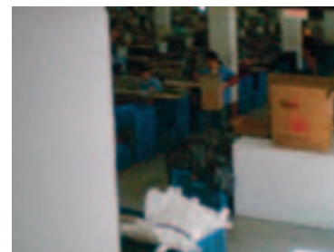
Pilas de telas inflamables en los talleres

En el Bloque B, por ejemplo, hay una sala de corte en cada piso. La principal tarea que se hace en ellas es cortar las grandes piezas de telas y otros textiles. Los trabajadores se quejan del polvo y la pelusa de las distintas telas que flotan en el aire en todas esas salas. La fábrica no brinda a los trabajadores ningún equipo de protección. Si una trabajadora quiere usar máscara, tiene que comprársela ella misma.