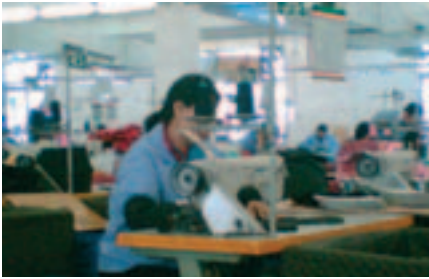
Una costurera se sienta en un taburete (sin respaldo) durante todo el turno de trabajo

problemas ergonómicos como dolor de espalda y de piernas. Las trabajadoras están sentadas en taburetes (sin respaldo) durante las 13 horas. Utilizan el pie derecho para controlar la máquina y sus manos para guiar el proceso de costura. Tras 13 horas de intenso trabajo, muchas mujeres se quejan de que les duele la pierna derecha y de que tienen la espalda completamente entumecida.