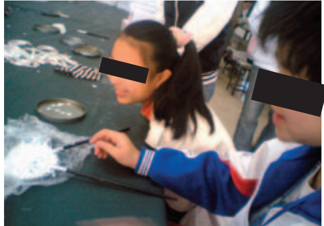
Alumnos de primaria y secundaria empleados en Lekit durante las vacaciones (un investigador de Juega Limpio trabajó con ellos en enero de 2007).

Lekit Stationery Co., Ltd. creada en 1977, es un fabricante con certificado ISO 9001 para productos de papel y cuero. Juega Limpio llevó a cabo su investigación en uno de sus establecimientos manufactureros situado en Dongguan, provincia de Guangdong.