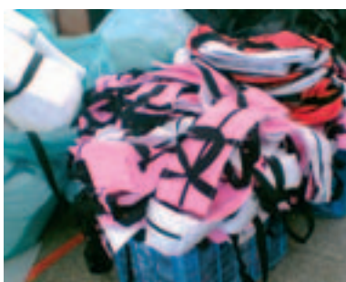
Trabajadoras cosiendo bolsos

17 - Diez yuanes (RMB) son alrededor de 0,97 euros.