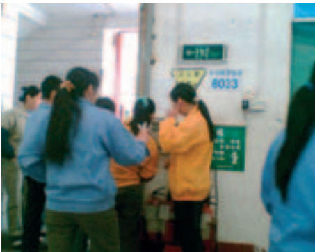
Una pequeñísima cantidad de extintores de incendio en la planta

En esos talleres de costura hay pilas de telas inflamables pero no hay matafuegos adecuados. A los trabajadores no se les ha brindado ningún tipo de información sobre lo que deben hacer en caso de incendio y si eso ocurriera los resultados serían desastrosos, se le dijo a Juega Limpio.