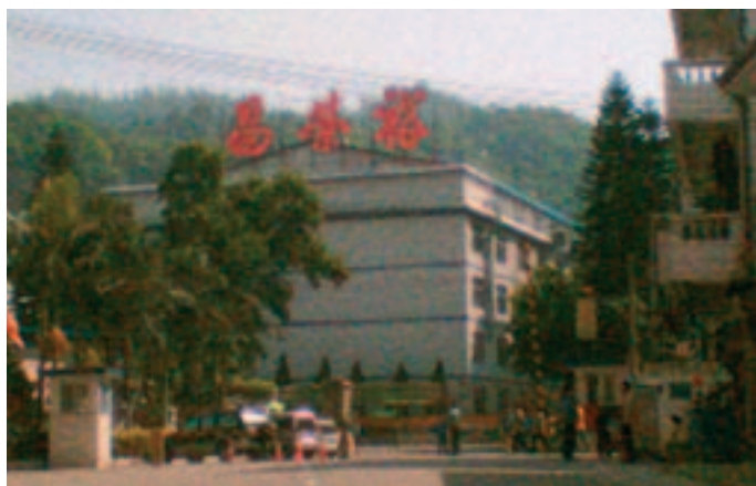
La fábrica de bolsos está en el Distrito de Longgang, Shenzhen

El complejo manufacturero de la empresa YWC de Shenzhen es grandísimo. Está compuesto por cinco edificios donde están las fábricas, los Bloques K, A, B, C y D (con alrededor de 3.000 máquinas de producción) y un edificio de tres pisos donde están los dormitorios, los comedores, una clínica, instalaciones para esparcimiento (una biblioteca, una cancha de baloncesto y una mesa de billar) y prácticos negocios.