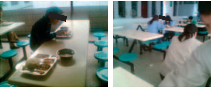
El comedor de la fábrica proporciona comida por 120 yuanes mensuales.

Los trabajadores encuentran satisfactoria la comida y el alojamiento que proporciona la empresa YWC. No obstante, se quejan porque estiman que el precio de 120 yuanes mensuales que les cobran es demasiado alto. Por esa suma, el comedor de la fábrica les da nada más que dos comidas diarias. A los trabajadores que optan por comer fuera de la fábrica no se les descuenta la comida, pero comer afuera es más caro.