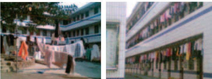
Un dormitorio de tres pisos para trabajadores

Los trabajadores encuentran satisfactoria la comida y el alojamiento que proporciona la empresa YWC. No obstante, se quejan porque estiman que el precio de 120 yuanes mensuales que les cobran es demasiado alto. Por esa suma, el comedor de la fábrica les da nada más que dos comidas diarias. A los trabajadores que optan por comer fuera de la fábrica no se les descuenta la comida, pero comer afuera es más caro.