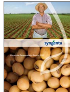
Der Corporate Responsibility Bericht 2007 von Syngenta