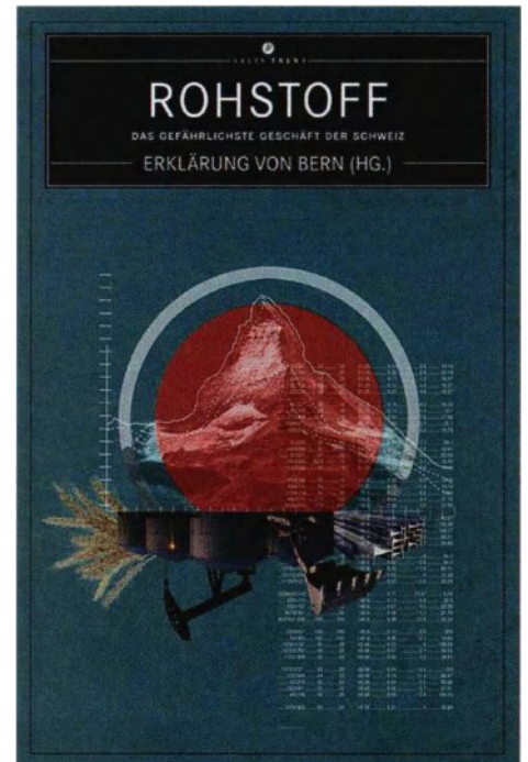
Anklage gegen Superreiche: Buch der EvB.

* Erklärung von Bern: Rohstoff – Das gefährlichste Geschäft der Schweiz. Salis. Fr. 37.90