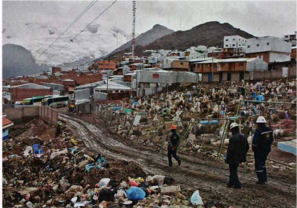
Abfallberge neben dem Friedhof: In La Rinconada ist so ziemlich alles illegal.