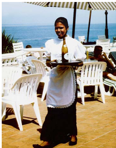
Frauen machen 60 bis 70 Prozent der Beschäftigten im weltweiten Tourismus aus.

Indigene, ethnische Minderheiten, Landlose, Frauen und Kinder profitieren kaum vom Tourismus, wenn sie nicht spezifisch unterstützt und mit Bildung und Zugang zu erschwinglichen Krediten als «Starthilfen» für eigene kleine Betriebe gefördert werden. Tourismus schafft zwar Arbeitsplätze, doch sind die Arbeitsbedingungen oft prekär und die Löhne tief, wie die Berichte der Internationalen Arbeitsorganisation ILO belegen. Kinder und Jugendliche unter 18 Jahren machen gemäss Schätzungen der ILO 10 bis 15 Prozent der Beschäftigten im Tourismus aus. Zudem schafft der Tourismus nicht nur Arbeit, er vernichtet auch Arbeitsplätze in traditionellen Erwerbszweigen wie der Fischerei oder der Landwirtschaft. Die Einhaltung der elementaren Rechte der Bewohnerinnen und Bewohner in Tourismusgebieten – Rechte auf Grundversorgung und